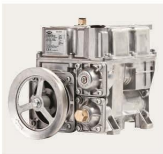
Bomba de Succión